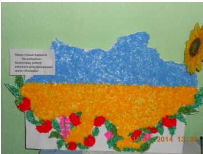
Синє небо, жовте жито – цю святиню знають діти